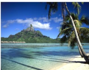
Photo plage et cocotier

J'ai choisi cette image car celle-ci me permet de m'évader... Que j'aimerais partir loin des bruits de la ville, loin du stress quotidien, loin du travail, loin des cris des enfants. 4 enfants c'est beaucoup de bonheur, ils me comblent, mais c'est aussi beaucoup de fatigue et ce paysage paradisiaque me tenterait bien des fois. Je ferme les yeux et ça y est je suis dans cet azur seule au milieu des palmiers, reposée et heureuse...