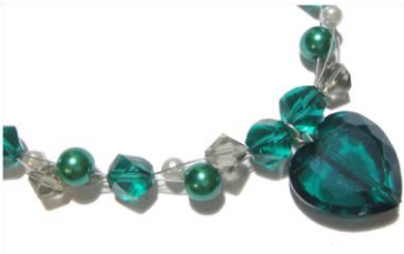
Photo collier bleu

J'ai choisi cette image car ce collier est trop beau, en plus il y a un cœur. La couleur est magnifique, elle est brillante. Elle me fait penser à la mer et à la montagne. J'aime les colliers car quand on les met, on est trop belle. J'aime m'amuser avec mes bijoux et mon maquillage.