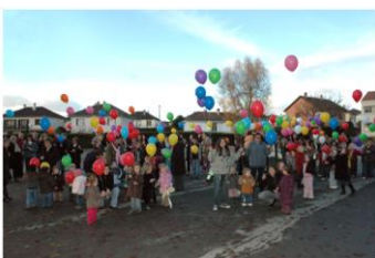
Photo rue avec personnes et ballons de toutes les couleurs